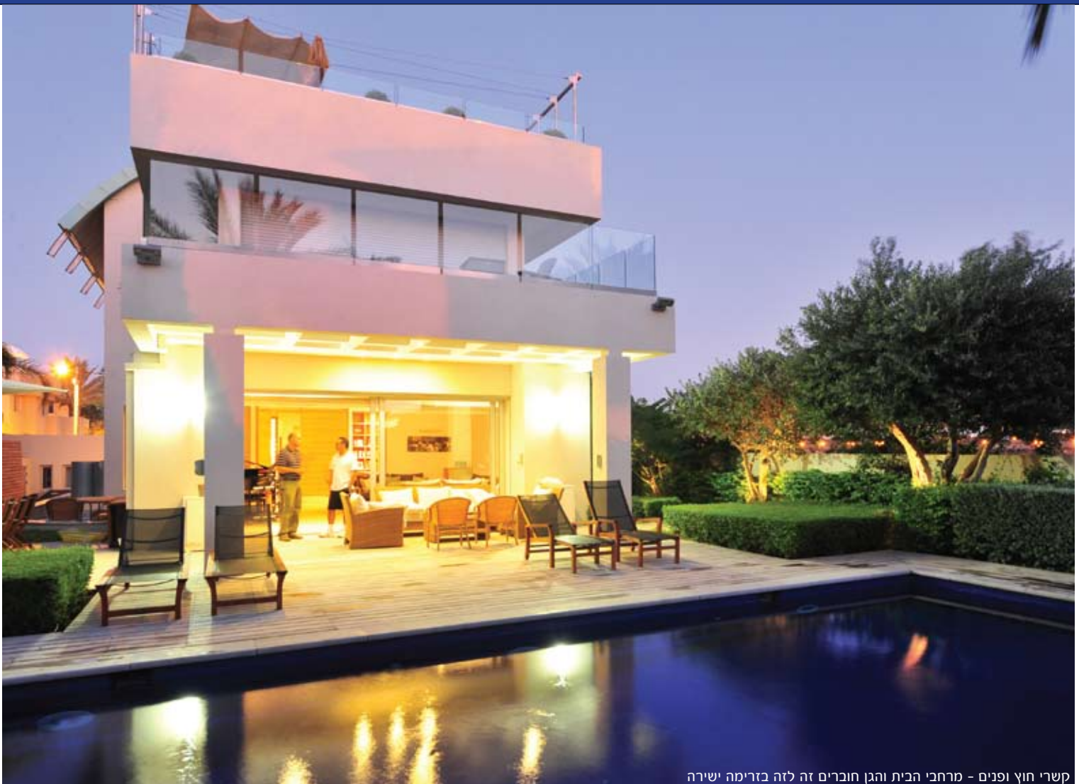
קשרי חוץ ופנים - מרחבי הבית והגן חוברים זה לזה בזרימה ישירה

בשלב האחרון של התכנון איחדנו לתוך כל ההחלטות שהחלטנו עד כה את הסגנון הים תיכוני אותו רצינו להרגיש בגן. ראשית, על ידי שימוש בצמחייה מקומית כגון: עצי תמר, עצי זית, הדורים, רימונים וברושים, ובשיחים נבחרו שיחי רוזמרין, סנטולינה אפורה, הדס, אוג, דורנטה תאילנדית, מללויקה גרין-דום וליוקופילום קומפקטום. בבחירת השיחים, הקפדנו על שילוב כאלה שמגיבים טוב לגיזום ושניתן לעצבם ולסדרם על פי הצורך בתחזוקה מתאימה. בנוסף, כיאה לסגנון ים תיכוני מובהק, שולבו בגינון שיחים רב שנתיים בעלי עלווה צבעונית ובכך הרחבנו מעט את המושג "ירוק" לצבעים קרובים, אך עדיין שמרנו על מספר קטן של גוונים. צבעי הצמחייה ששולטים בגן הנם: ירוק - צבע ההדרים, הברושים, ההדסים, שיחי האוג, הרוזמרין והמטפסים סביב מסוג פסיפלורה ויסמין. אפור - צבע הזיתים, התמרים, שיחי הליוקופילום והסנטולינה האפורה. צהוב - צבע שיחי הדורנטה התאילנדית והמללויקה (ירוק בהיר) לגבי המשטחים הפתוחים - לטובת תחזוקה ונוחות ויתרנו על דשא ועשינו שימוש במשטחים מרוצפים גדולים מסוג אבן ועץ במראה אפרפר. במדרגות הכניסה, במעברים ובפינת האוכל והברביקיו השתמשנו באבן ג'ת אפורה בגימור מוברש, ובאזור הברכה ופינת האוכל הקדמית שליד המטבח, אותה פינה המיועדת לארוחות הבוקר, השתמשנו בדק עץ מסוג איפאה, אותו בחרנו לא לשמן בכדי לגרום לעץ להאפיר עם הזמן ולהתאים את גונו לגוון האבן.