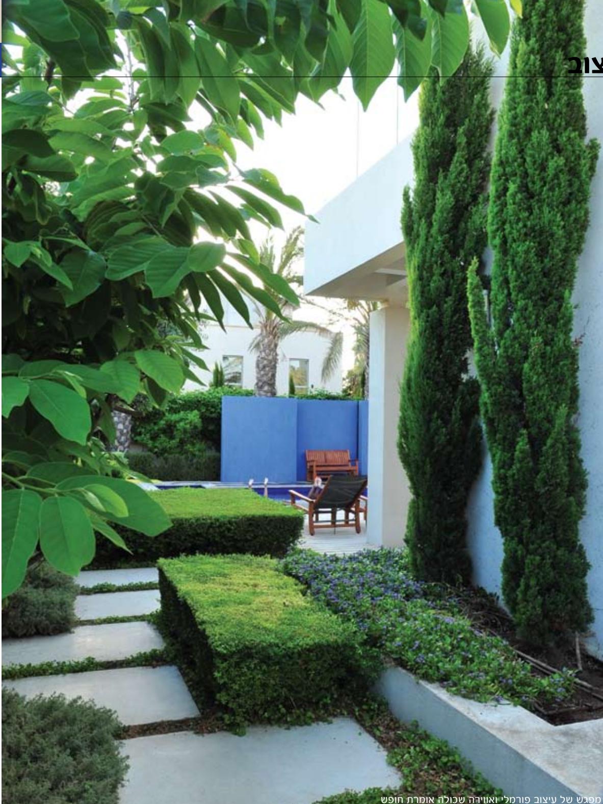
מפגש של עיצוב פורמלי ואווירה שכולה אומרת חופש