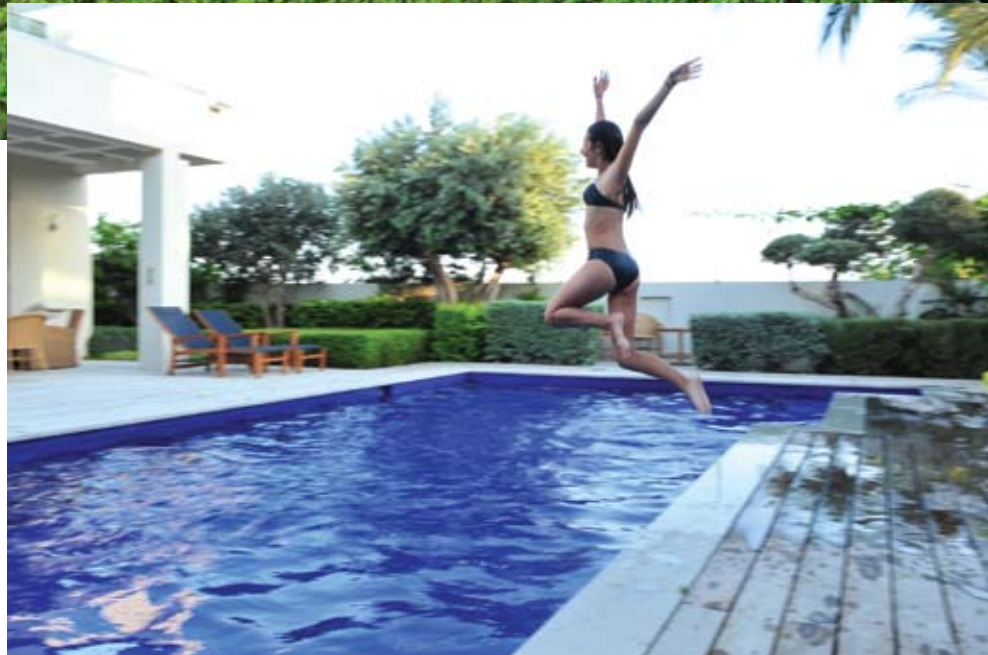
תחושת חופש ונופש - בריכת השחיה ואזורי ישיבה שונים סביבה

העקרונות המובילים שהנחו את בעלי הבית ושעל פי הן עוצב הגן היו: - ביצוע תשתיות טובות ושימוש בחומרים איכותיים. שכן למרות שהגן מנוצל רק שלושה חודשים בשנה, לכל היותר, הוא צריך "לתפקד" כראוי במשך כל ימות השנה. הדבר נכון לכל המרכיבים לרבות משטחי הריצוף, בריכת השחייה, הצמחים, מערכת ההשקיה, התאורה, פינת הברביקיו וכיו"ב. - מינימום שינויים ומינימום תחזוקה. יצירת גן שנראה חי, נקי ומסודר בכל עונות השנה, ובו בזמן אינו מצריך שתילה מחדשת ורענון אחת לכמה חודשים ודורש תחזוקה מינימאלית בלבד. - עיצוב על פי סגנון צרפתי פורמאלי ונקי אך עם שילוב נגיעות ים תיכוניות. גן בעל מראה גזום ומסודר הנהוג בגני הצרפתיים המפורסמים המוכרים לנו כמו גני וורסאי למשל, אך חופשי ומאוורר יותר. - יצירת אווירה של חופש. גן שיעניק לבעליו הרגשה של רוגע, נינוחות ושקט, כמו שמצופה ממקום חופשה.