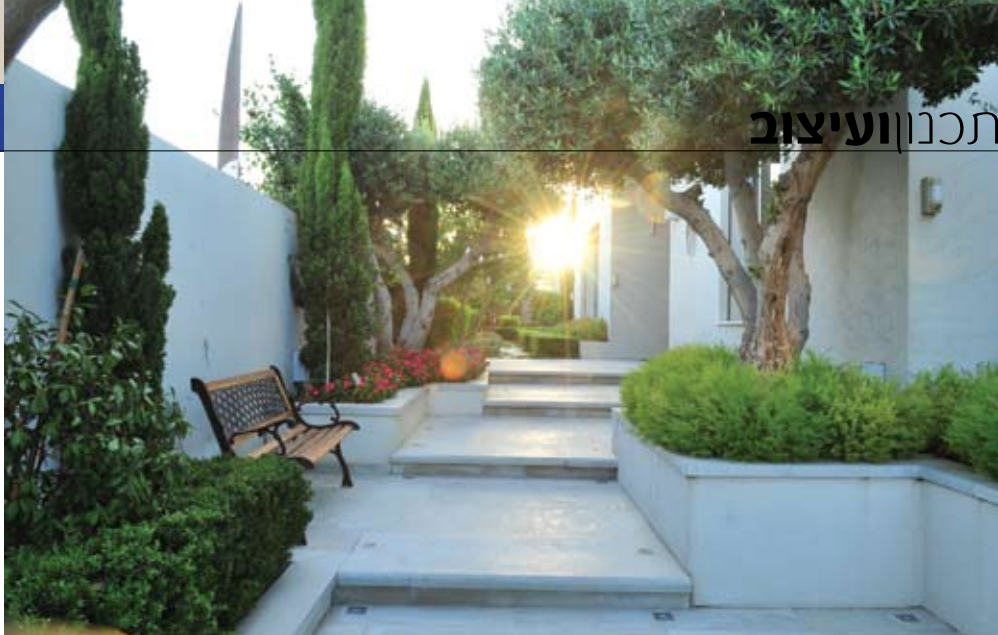
מראה מסודר ומאורגן שבביל הכניסה לגן

לאחר מכן הגדרנו את המושג "פורמאלי" מבחינה עיצובית, תוך בירור עד כמה אנו רוצים להרחיק עם סגנון העיצוב הזה. האם כל הגן יהיה מסופר וגזום והעצים ניצבים כחיילים במסדר, או שמא ניתן להסתפק באזכור הפורמאליות ו"לשחרר" מעט את האווירה בגן. בעניין זה, לשמחתי, החלטנו יחד ליצור שתי שכבות בצמחייה: צמחייה שיחים תחתונה שתישתל בצפיפות ותיגזם על פי הסגנון הפורמאלי, ואילו העצים שיצאו מתוכה יהיו פחות "מסודרים" - בעלי צורה פחות או יותר אחידה, אך בהחלט לא גזומה וקצוצה על פי תבנית. באזור הבריכה החלטנו לעזוב את הקו הפורמאלי ולשתול דקלי תמר במטרה ליצור אווירה נינוחה יותר המזכירה בתי מלון.